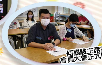
何嘉駿主席宣佈會員大會正式開始！