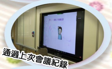
通過上次會議紀錄