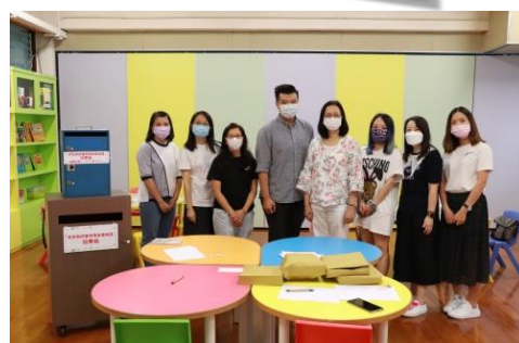
完成點票，義工大合照