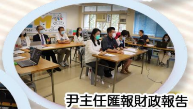
尹主任匯報財政報告