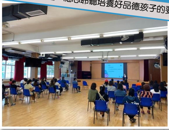
家長齊集禮堂，細心聆聽培養好品德孩子的要素