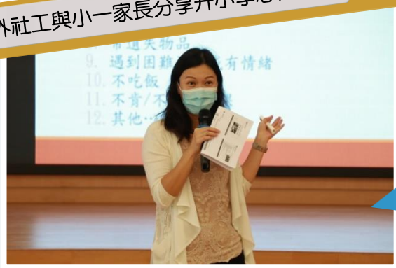
校外社工與小一家長分享升小學心得